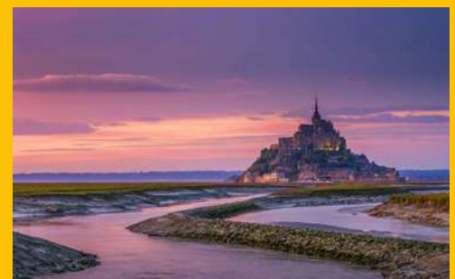
MONT SAINT MICHEL