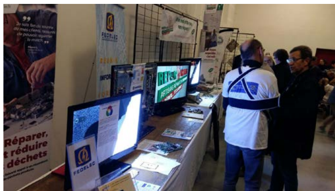
Soreze nov 2016