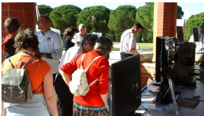
Carbone Free Forum octobre 2016