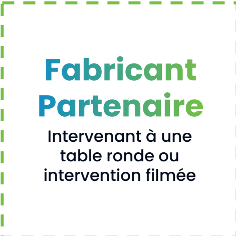
Parrain de l'évènement