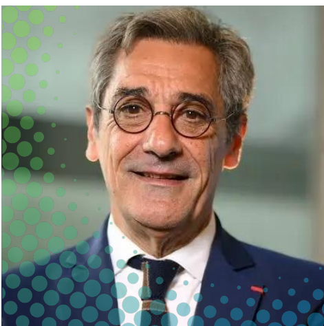
Serge PAPIN* Ministre des PME, du Commerce, de l'Artisanat, du tourisme et du Pouvoir d'achat