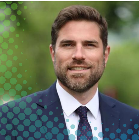
Vincent JEANBRUN* Ministre de la Ville et du Logement