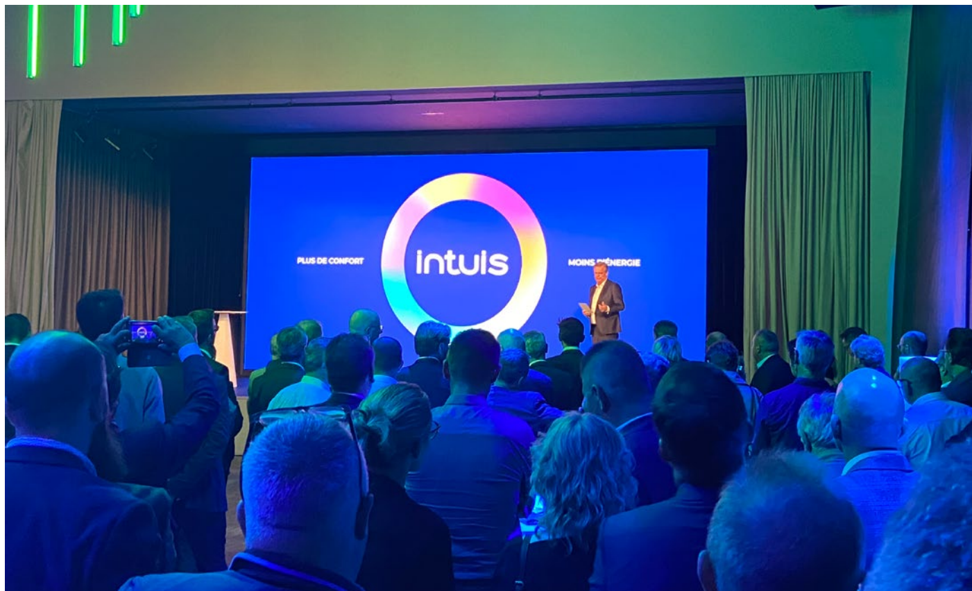
Lancement de la nouvelle identité le 8 septembre 2022

Cette transformation participe au développement de l'emploi et des savoir-faire dans le groupe. Pour accompagner ses ambitions, intuis recrute en effet 200 nouveaux collaborateurs en CDI en 2022.